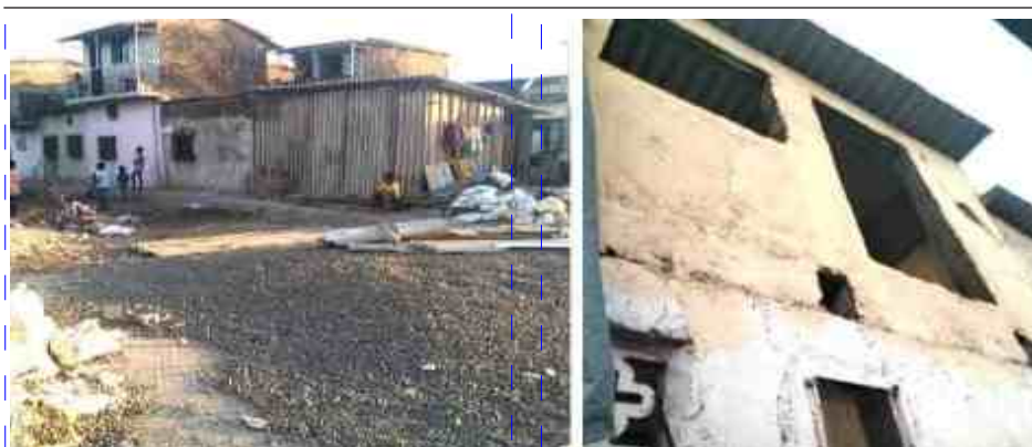
पहें अगले अंक में

आशा करती है कि उक्त अवैध दो मंजिला इमारत का अवैध निर्माण हटाकर कलेक्टर लैंड को खाली कराकर भूमाफिया पर एमआरटीपी एक्ट के तहत कानूनी कार्रवाई की जाये. क्योंकि जिस तरह का घटिया किस्म का मटेरियल से उक्त अवैध निर्माण किया गया है यह कभी भी धोखादायक साबित हो सकती है, स्थानीय जनता द्वारा अपने निवेदन में पत्रकार को बताया कि उक्त अवैध निर्माण पर जल्द से जल्द तोड़कर कार्रवाई की जाये अन्यथा स्थानीय जनता तीव्र आंदोलन करेगी और इसकी जिम्मेदार मनपा आयुक्त और मनपा अधिकारी होंगे.